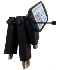
Le trousseau d'adaptateurs.