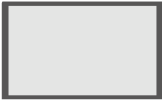
La télévision projette l'écran de l'ordinateur.