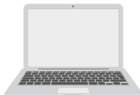
L'ordinateur portable avec les logiciels nécessaires installés.