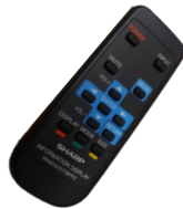
La télécommande de la télévision contrôle les paramètres de celle-ci.