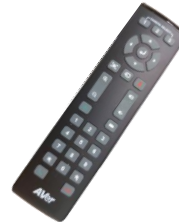
La télécommande de la barre vidéo AVER contrôle les paramètres de celle-ci.